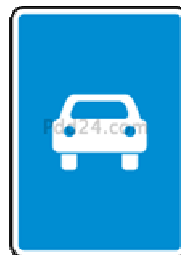
5.3 Дорога для автомобилей.